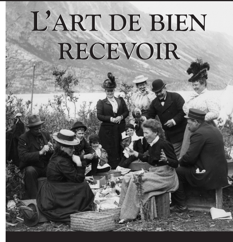
Pique-nique au lac Bennett

pour télécharger les formulaires de demande et de commande.